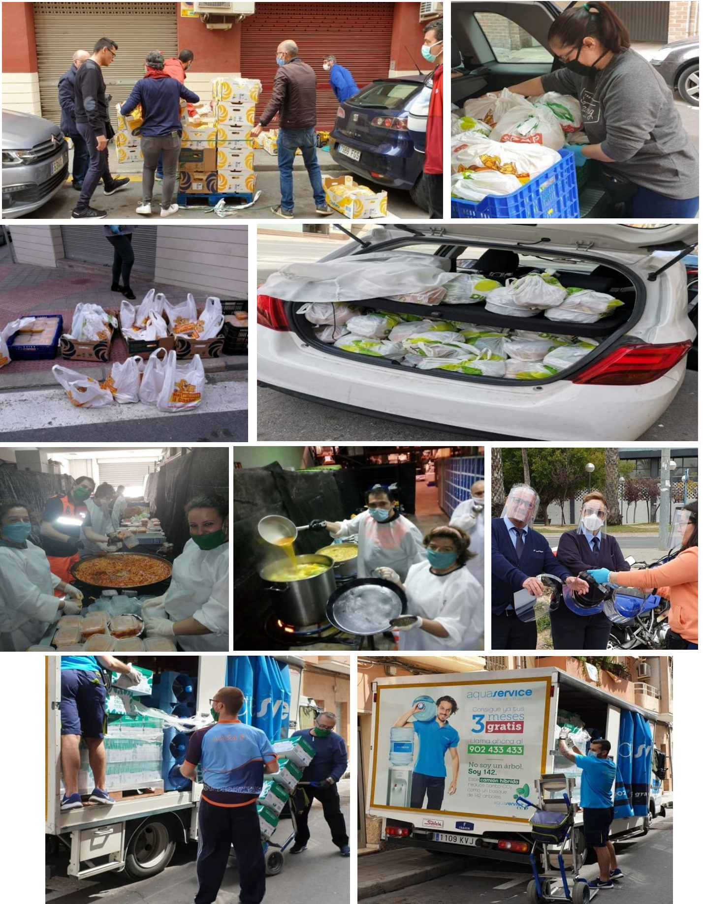
Figura 2. Diversas actividades llevadas a cabo.