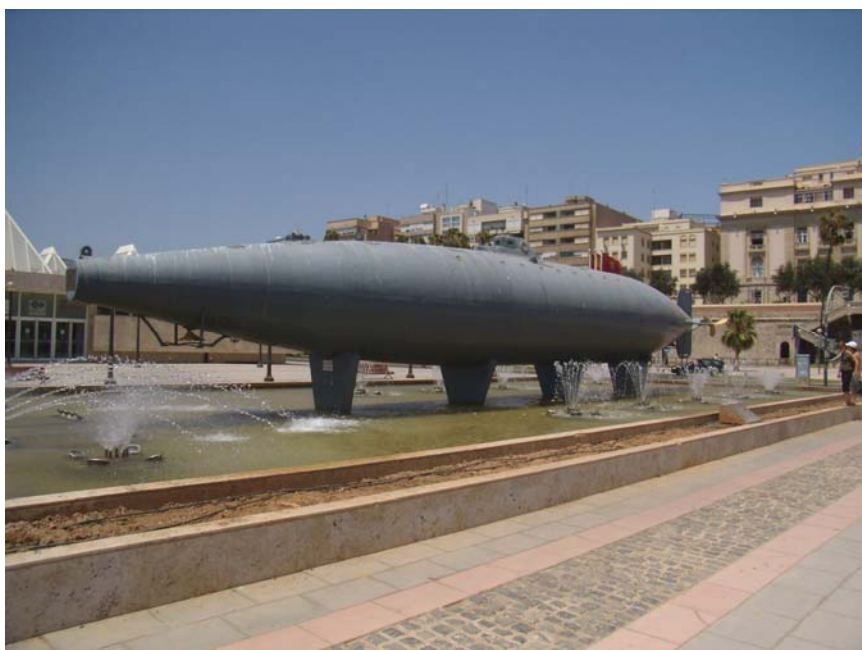
Submarino Isaac Peral