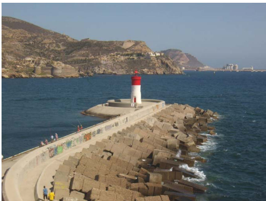
Faro de navidad

19:30 Ahora nos refrescamos bajo el agua de la ducha y nos quedamos en la cama estirados para descansar un rato.